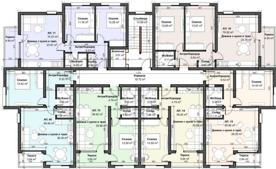
РАЗПРЕДЕЛЕНИЕ ПЛАН КОТА +5,70