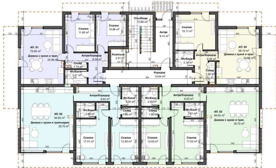
РАЗПРЕДЕЛЕНИЕ ПЛАН КОТА +0.00