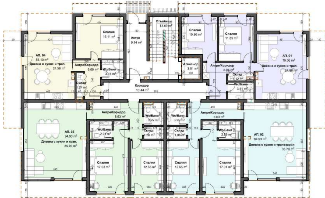
РАЗПРЕДЕЛЕНИЕ ПЛАН КОТА ±0,00